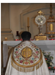
Après l'adoration, départ de la procession dans les rues de Paris.