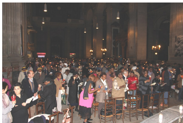
Marche chantante suivie de la nuit de prière dans l'église Saint-Sulpice, juin 2012