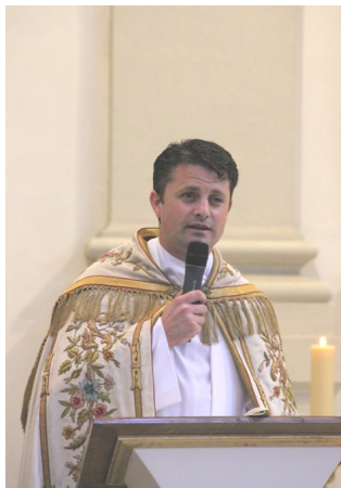
Le Père de Penfentenyo

Veillée et procession - 127 e nuit de prière