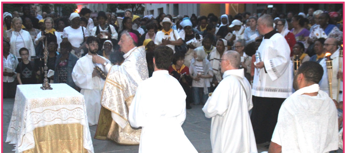
Station de la procession devant l'église St-Séverin

Le premier moment est l'accueil du don gratuit de Dieu dans notre vie. C'est l'action de grâce, Dieu est avec nous. À l'Annonciation, Marie a anticipé en elle, dans son corps, ce qui se réalise en tout croyant qui communique, écrit Jean-Paul II. Nous sommes ainsi invités à reproduire avec ce sacrement ce que Marie a reçu dans son corps.