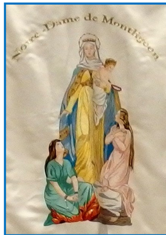
Bannière de N.-D. Libératrice

que j'y crois vraiment ? Oui, « Dieu est maître du temps et de l'histoire » : c'est sur ces paroles que nous pouvons fonder toute notre vie et notre espérance.