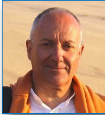
Philippe Rayet © L'Unité

(Extraits) Intégralité sur www.pourlunite.com