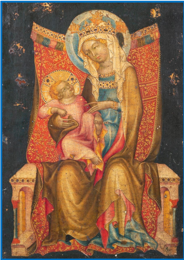
Vierge à l'Enfant. Tableau sur bois, Prague, 1350, peint par le Maître de Vissy Brod. L'œuvre, retrouvée dans une famille à Dijon, vient d'être acquise (déc. 2019) par un musée de New York (MET).

Tel est le grand mystère de la communion des saints : l'unité de tous les rachetés dans l'amour du Dieu Trinitaire, au sein d'une même Église une, sainte, catholique et apostolique – et cela, sur les pas du Ressuscité, jusque dans la Vie Éternelle, où nous attendent tous ceux que nous avons aimés. ●