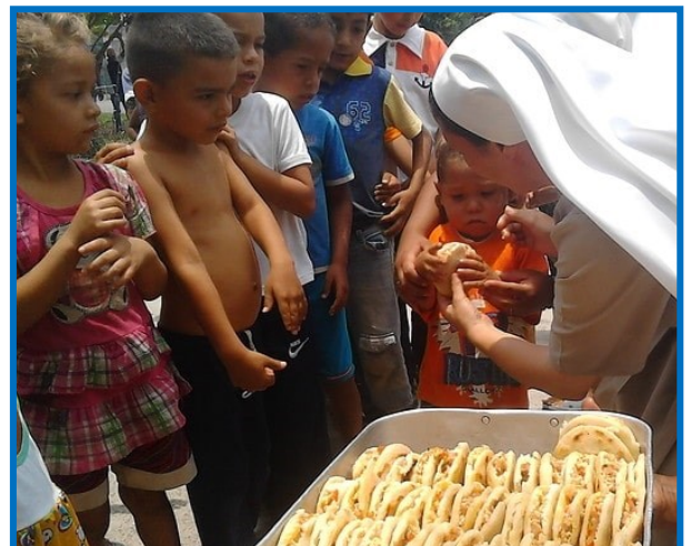
Distribution de nourriture. Venezuela